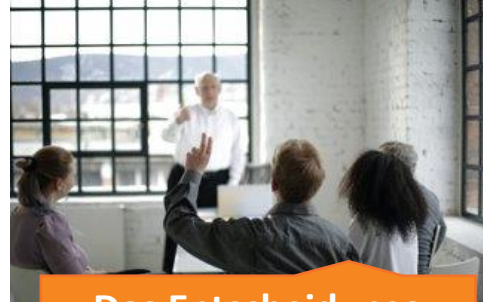
Das Entscheidungs- meeting