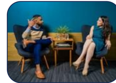
Freestyle: Ihre Idee formen