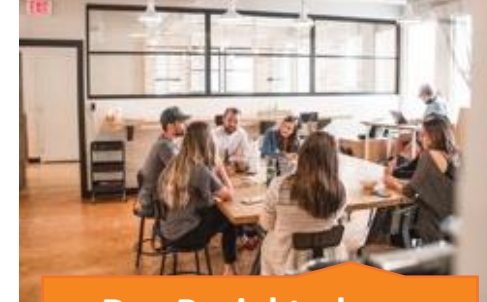
Das Projekt ohne gemeinsame Basis