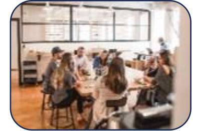
Peer Format: Kompetenzen erweitern

Alle Formate können weiter an Ihre Bedürfnisse angepasst werden (Multi-Personen-Sparring, etc.) und in andere Angebote von Mind your business wie z.B. Business Coaching oder Consulting integriert werden