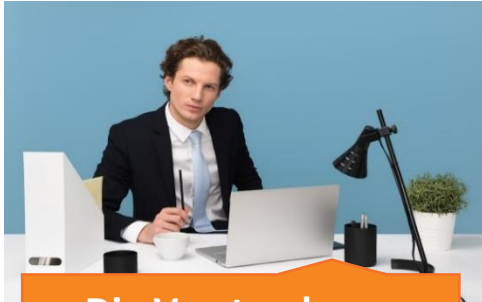
Die Vorstands- präsentation