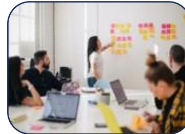
In-house: Eine neue Qualität etablieren