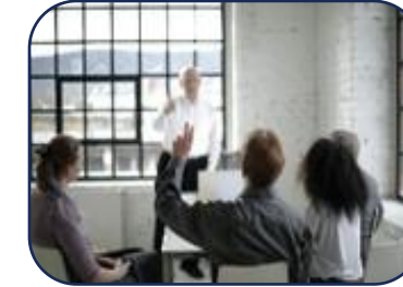
Challenger: Eine kritische Stimme hinzufügen