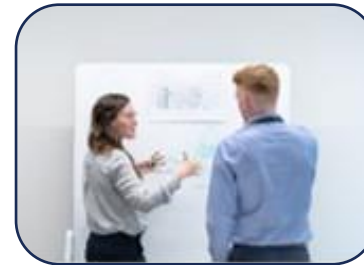
Klassik: Sie gut vorbereiten